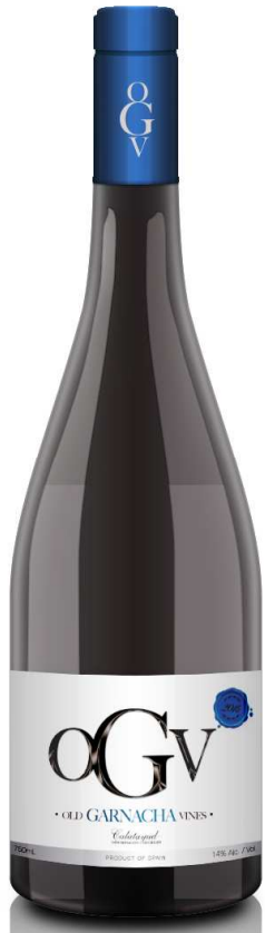
올드 가르나차 바인스