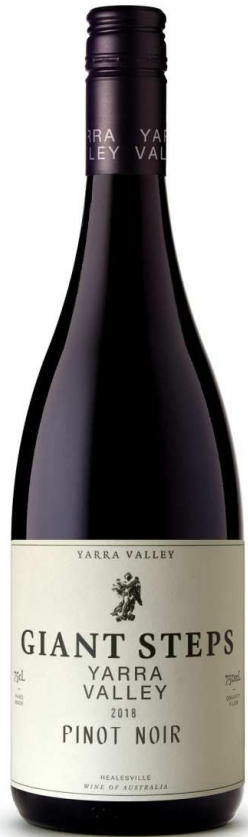
GS 야라 밸리 피노 누아