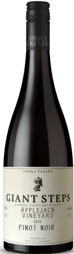
GS 애플잭 빈야드 피노 누아