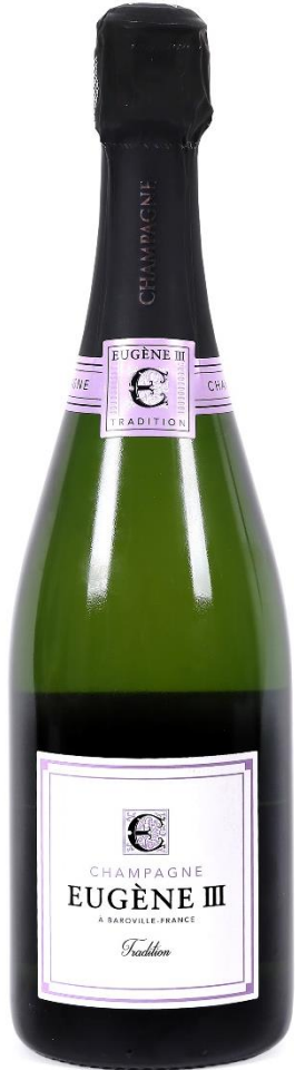
샴페인 유진 쓰리 트레디션