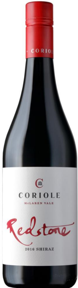
콜리올 레드스톤 쉬라즈