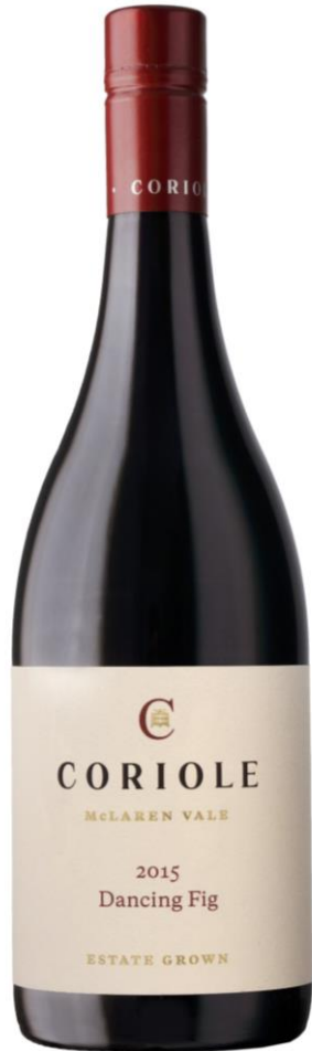
콜리올 댄싱 피그